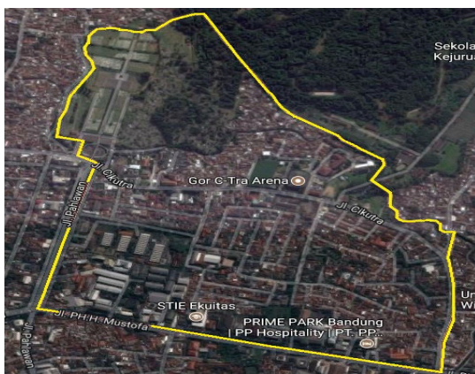
Gambar 1. Peta Kel. Neglasari

Luas wilayah Kelurahan Neglasari adalah 47.50 Ha, dengan jumlah Rukun Warga berjumlah 8 dan Rukun Tetangga berjumlah 39, berpenduduk 16.033 jiwa (sensus penduduk tahun 2016. Jumlah penduduk laki-laki 8.263 jiwa, sedangkan jumlah penduduk perempuan adalah 7.770 jiwa.