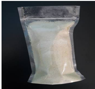
Gambar 5. Mikroenkapsulasi Jahe

pengolahan nira aren menjadi gula semut. Hal ini terlihat dari kecakapan yang dimiliki peserta pelatihan dalam membuat gula semut. Selain pelatihan teknologi pengolahan gula semut, kami pun memberikan pelatihan teknologi mikroenkapsulasi jahe.