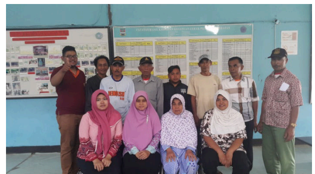
Gambar 4. Dokumentasi Peserta Pelatihan

Pelatihan pembuatan gula semut bagi para petani nira aren di Gununghalu dilaksanakan pada hari kamis, 28 Desember 2017 bertempat di Aula Desa Wargasaluyu, Kecamatan Gununghalu, Kabupaten bandung barat. Peserta pelatihan berjumlah 10 orang yang terdiri dari para petani nira di wilayah kecamatan gununghalu.