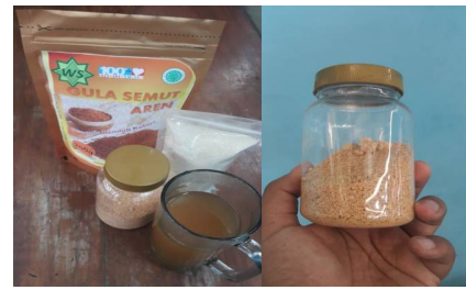
Gambar 6. Gula Semut Dalam Kemasan

Setelah mahir melakukan proses produksi, kami memberikan juga pelatihan desain kemasan. Pelatihan diberikan dengan harapan masyarakat dapat mengimplementasikan hasil pelatihan sampai ke tahap penjualan kepada konsumen, sehingga diharapkan dapat membantu meningkatkan perekonomian keluarga.