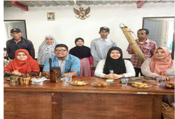
Gambar 2. Dokumentasi Tahapan Survey Lapangan

Tahapan survey lapangan bertujuan untuk membuat daftar inventarisir masalah. Survey lapangan dilakukan pada tanggal 25 April 2017 bertempat di Desa Wargasaluyu, Kecamatan Gununghalu, Kabupaten Bandung Barat.