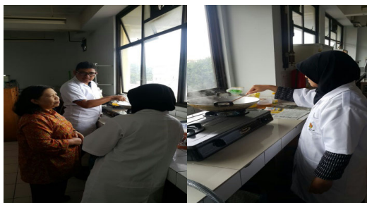
Gambar 3. Dokumentasi Tahapan Pelatihan Instruktur

Tahapan berikutnya yang dilakukan adalah pelatihan dari instruktur kepada peneliti mengenai proses pembuatan gula aren. Pelatihan telah dilaksanakan pada hari jumat 28 April 2017 bertempat di Laboratorium Penelitian Jurusan Teknologi Pangan UNPAS.